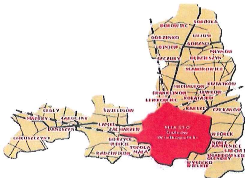
Położenie gminy wiejskiej Ostrów Wielkopolski na tle Miasta.