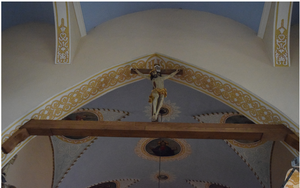
Fot. 6. widok na ścianę i łuk tęczy.