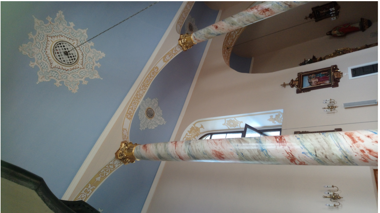
Fot. 3. Widok na sklepienie naw kościoła.