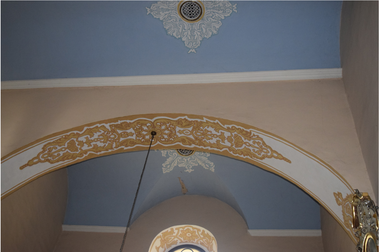
Fot. 5. Widok na łuk oddzielający kaplicę północną od nawy.