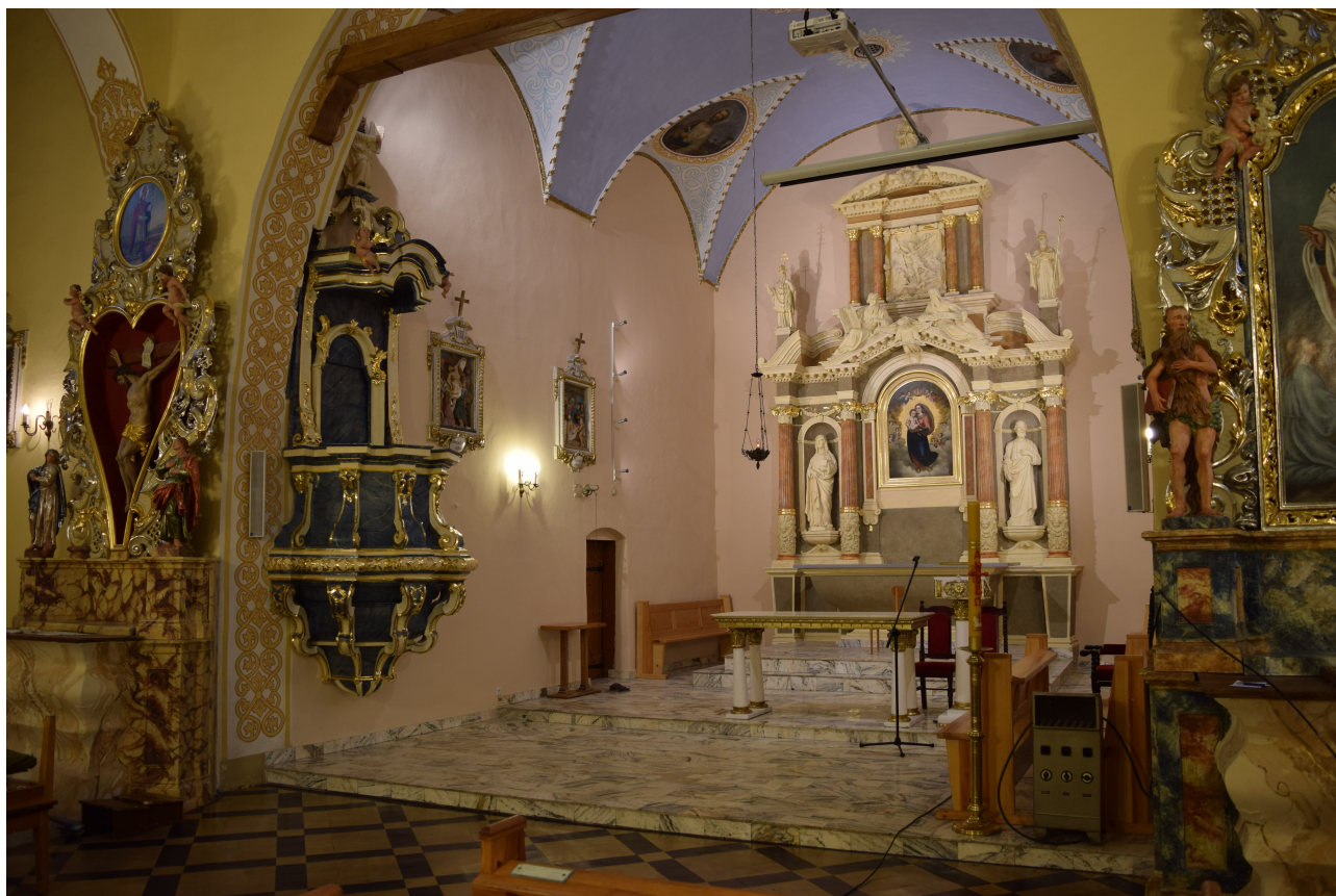
Fot. 1. Prezbiterium z polichromią stropu wykonaną w latach 90 tych.