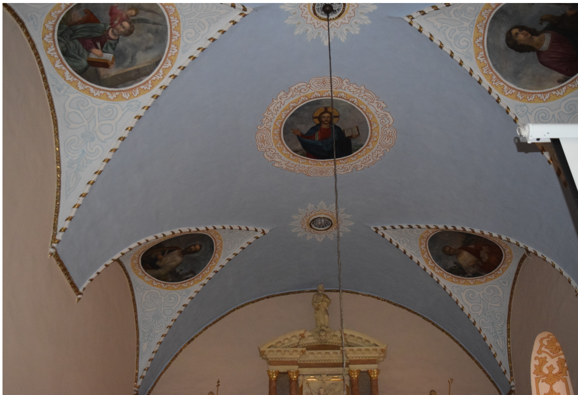
Fot. 4. Widok na sklepienie prezbiterium