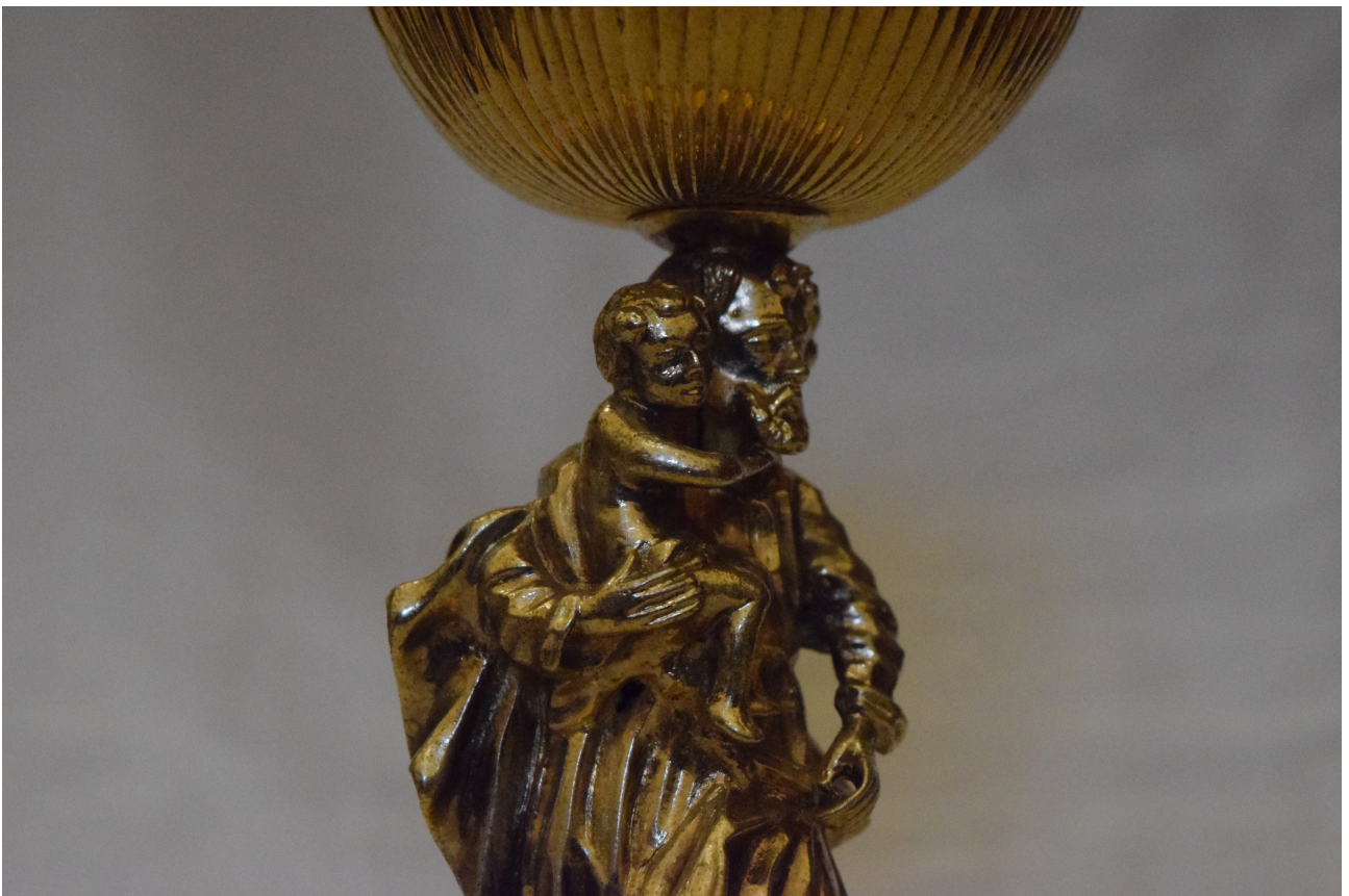
Fot. 6. Kielich z 1773, fragment z widocznym trzonem w formie figury św. Józefa.