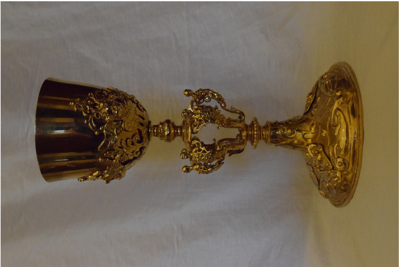
Fot. 7. Kielich XVIII w. widok ogólny.