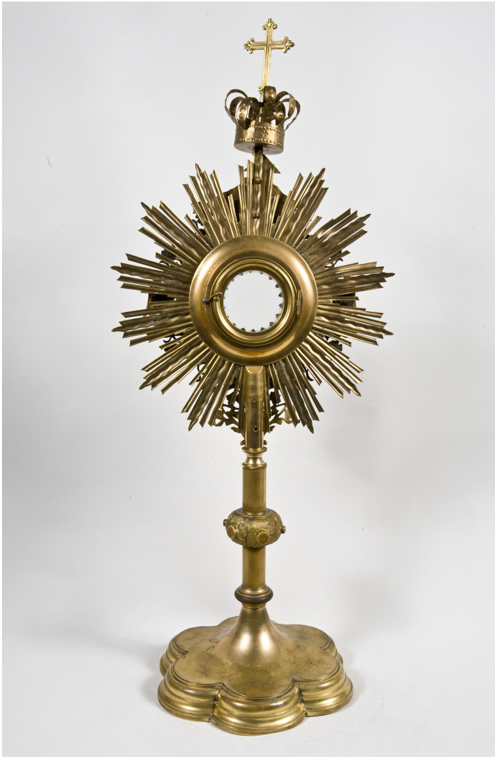
Fot. 4. Monstrancka pocz XX w. rewers.