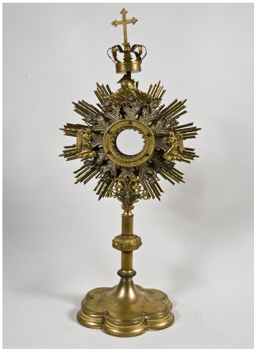
Fot. 3. Monstrancja pocz. XX w. awers.