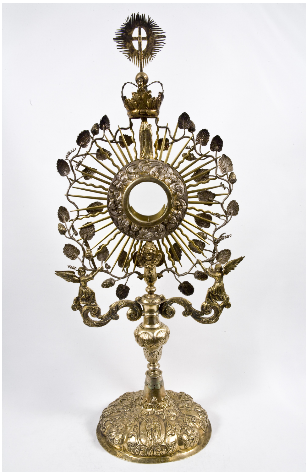
Fot. 2. Monstrancja XVII w. widok rewersu.