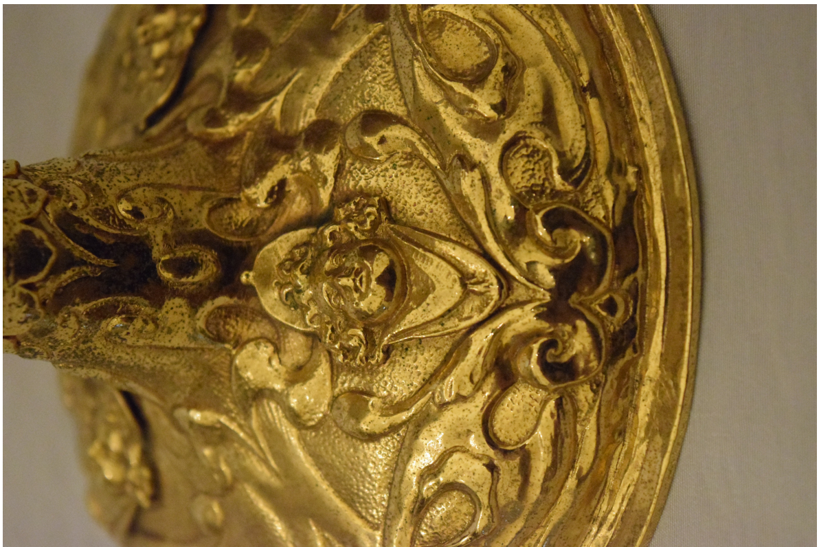
Fot. 8. Kielich XVIII w. fragment stopy.