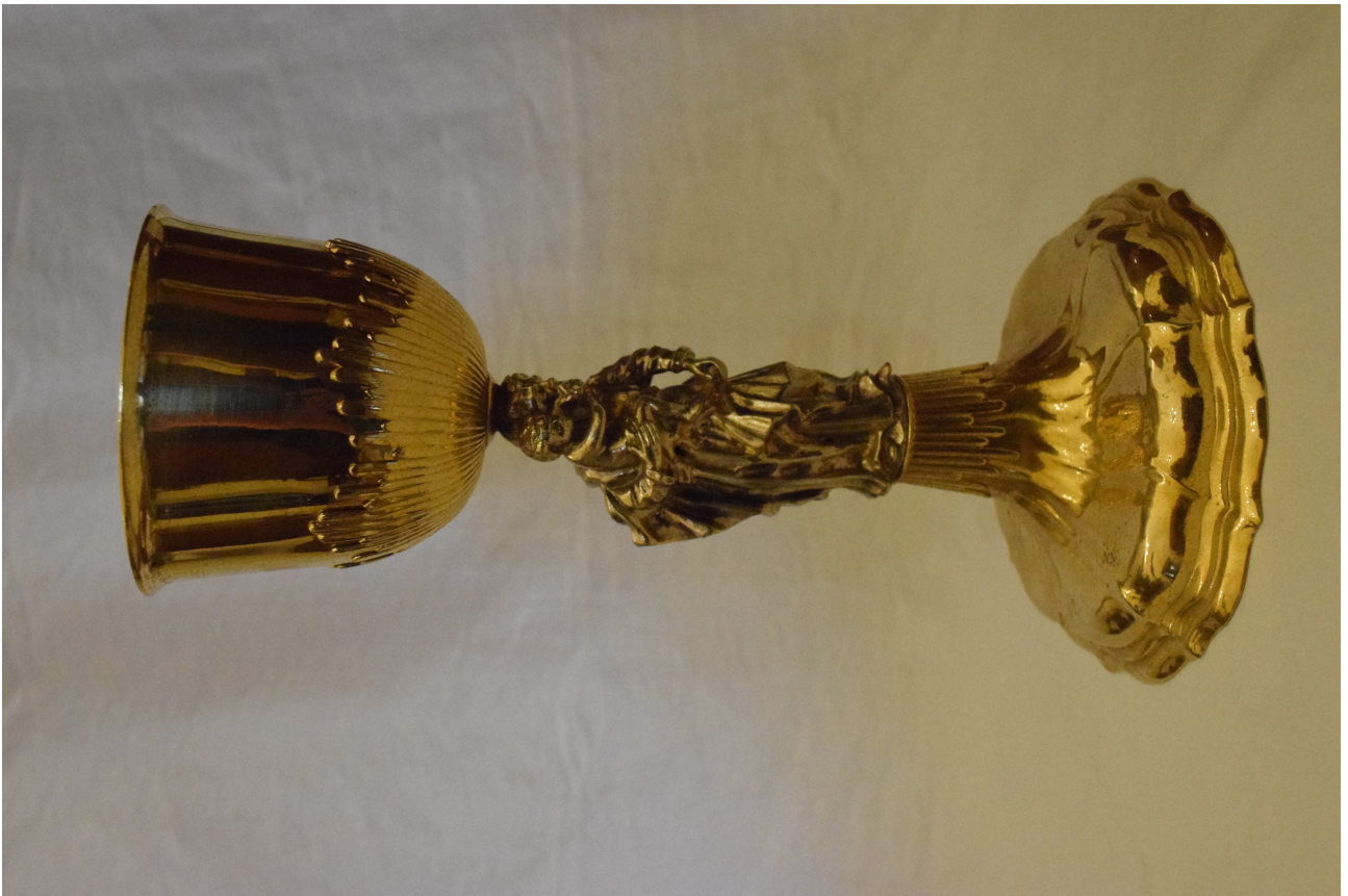
Fot. 5. Kielich z 1773, widok ogólny.